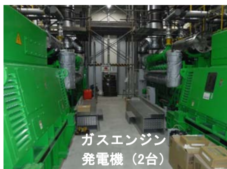
ガスエンジン 発電機（2台）