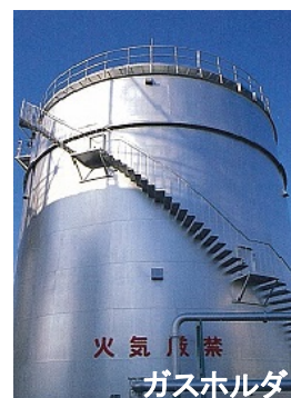
火気厳禁 ガスホルダー