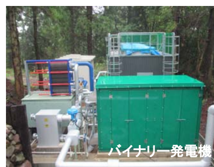
バイナリー発電機